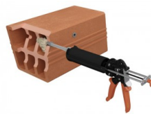
Injecter la résine.